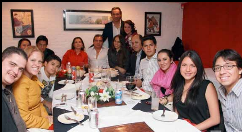
Familiares y amigos acompañaron a la festejada.